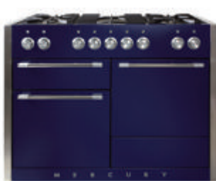
Neu Mercury 1200

Um unsere große Auswahl an Produkten zu entdecken, bestellen Sie unsere kostenlose Broschüre auf www.falcondeutschland.com oder rufen Sie uns an unter 0541 205 1843 .